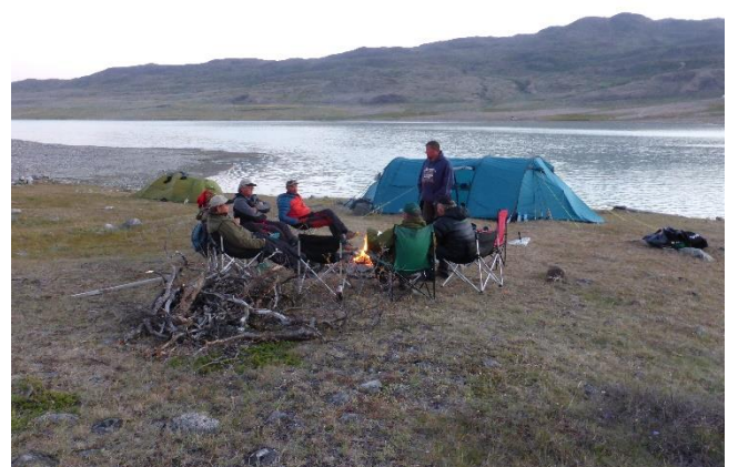
Gruppe med Mylla-fiskere på Grønland